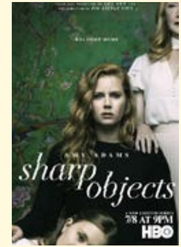
2019 – Sharp Objects