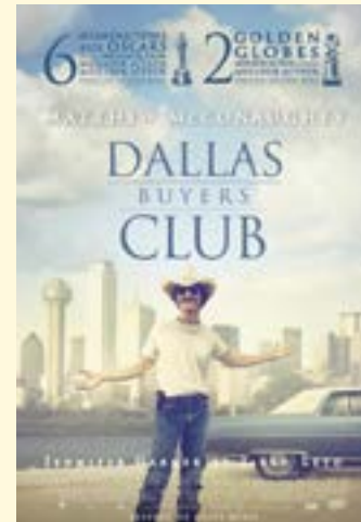
2013 – Dallas Buyers Club