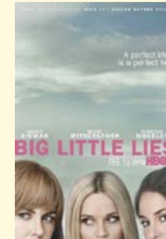
2017 / 2019 – Big Little Lies