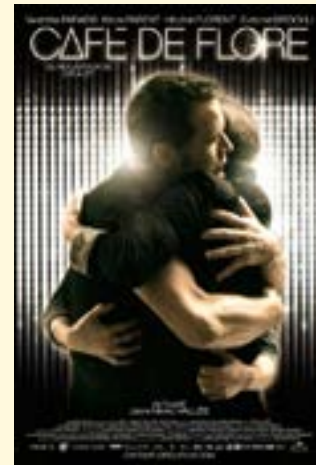
2011 – Café de Flore