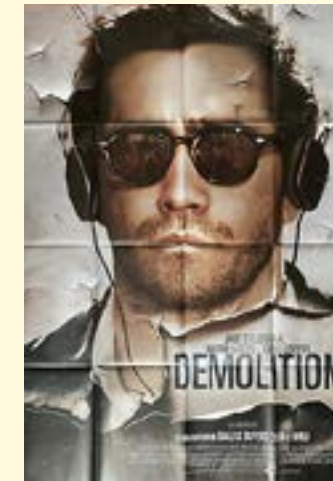
2015 - Demolition