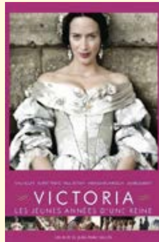
2009 – Victoria